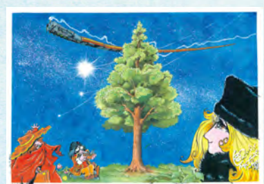
松本零士「銀河鉄道999」イラスト原画 © 松本零士 個人蔵