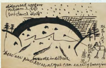
宮沢賢治 保阪嘉内宛葉書 1917(大正6)年9月2日消印 寄託資料

閲覧室資料紹介「宮沢賢治の世界」 会期 9月20日(金)~11月24日(日) 会場 1階 閲覧室 入場無料